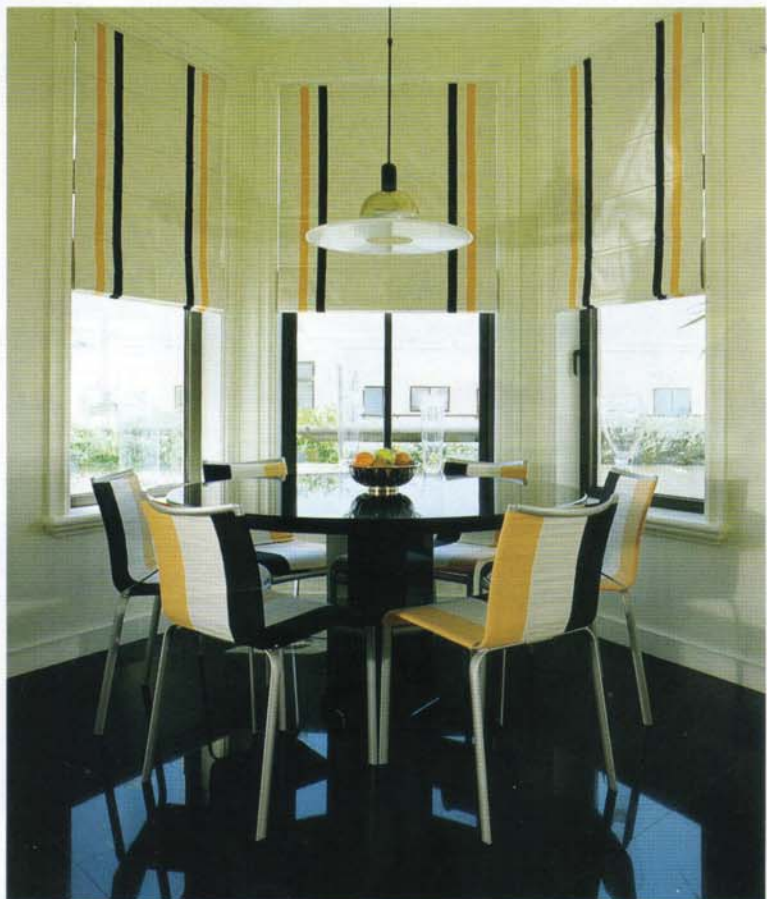
Zona de refeições da cozinha