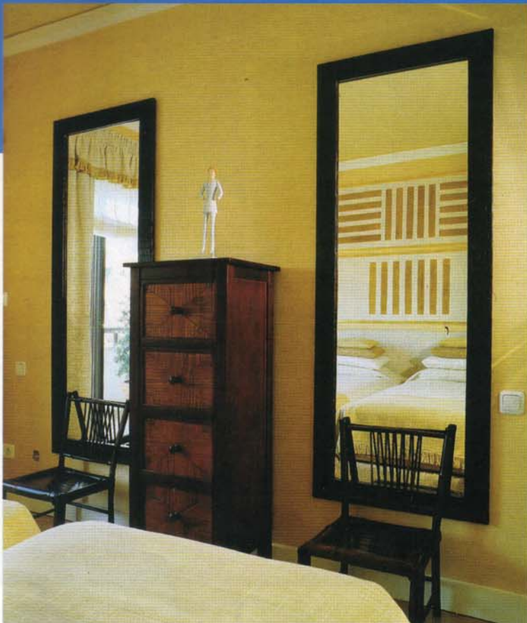
Quarto de visitas