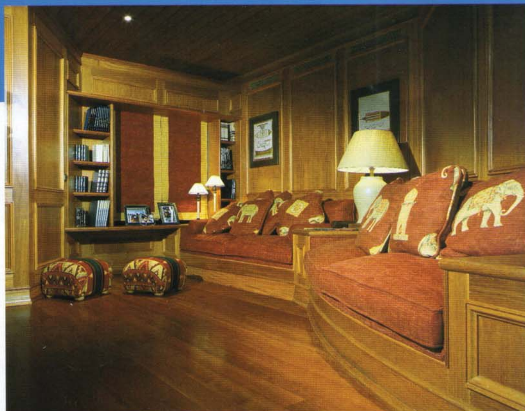
Sala de bilhar